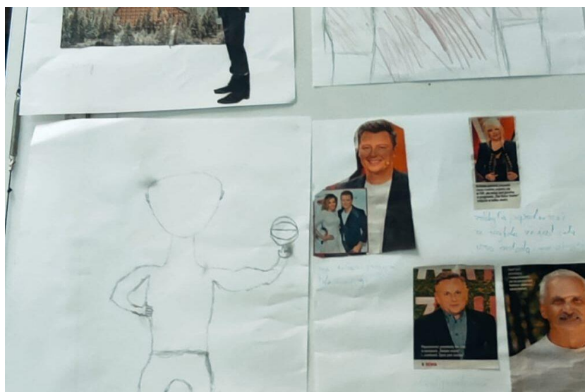
Zdjęcie przedstawia plakat „Człowiek sukcesu” wykonany przez uczniów podczas zajęć modelowych na temat poczucia własnej wartości